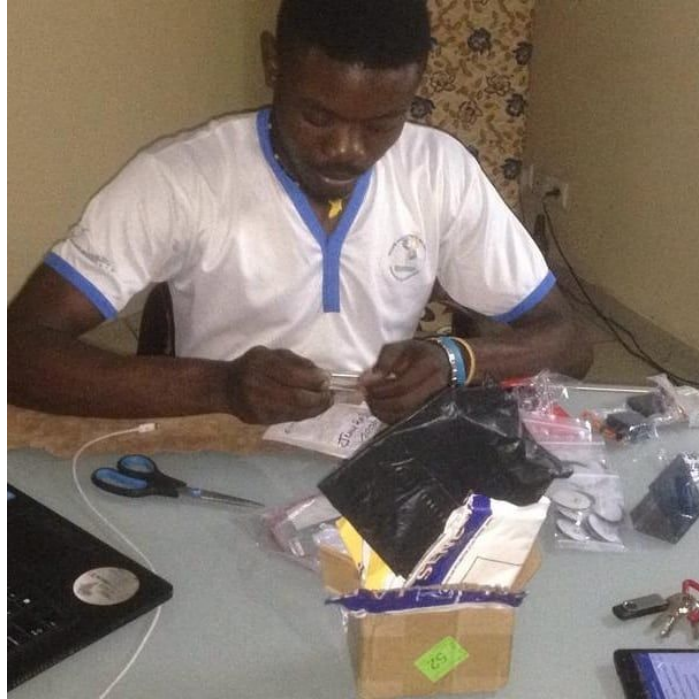
JUNGO AFRICA montage moteur prothèse