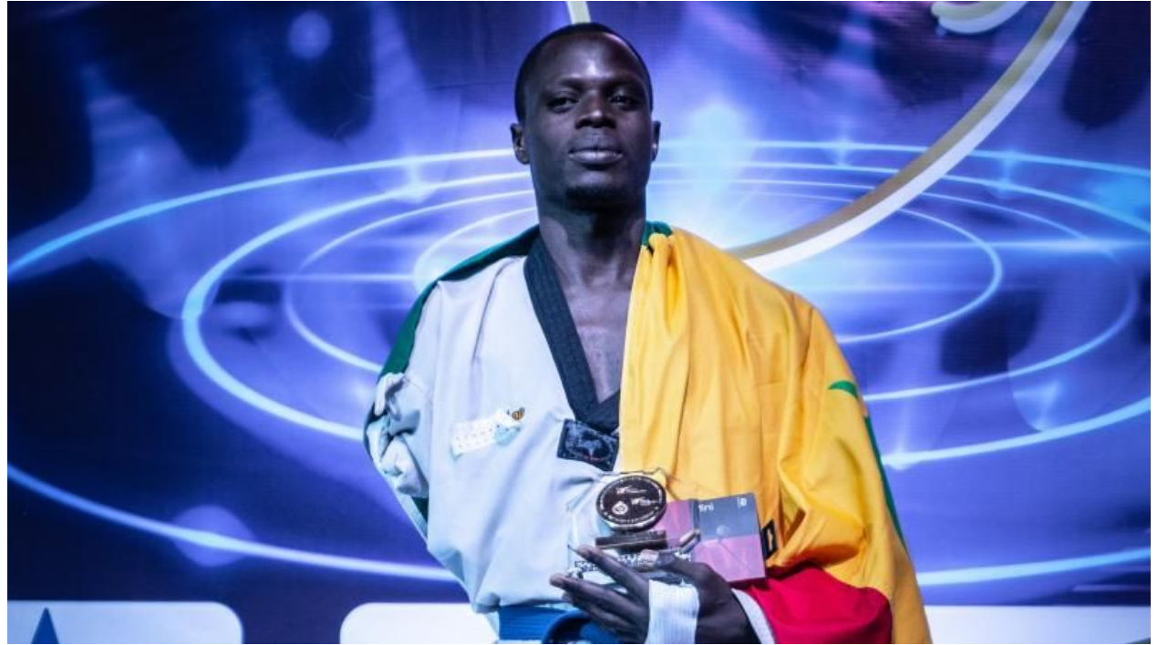
Ibrahima SEYE , Champion d'Afrique para taekwondo